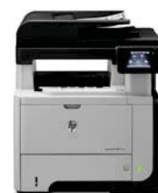
Impresora multifuncional HP LaserJet Pro M521dw