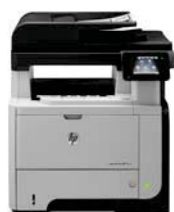
Impresora multifuncional HP LaserJet Pro M521dn